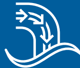
WATERFLOW Hydraulisch geoptimaliseerd