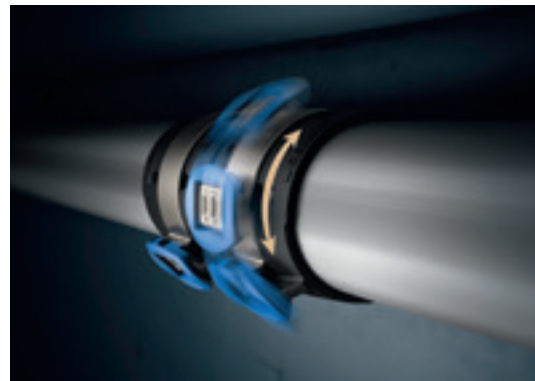
↑ Door de draaibare fitting kan in elke positie geperst worden.

↑ Zelfs op zeer smalle of moeilijk bereikbare plaatsen is een veilige installatie gegarandeerd. De comfortabele werkhouding door de draaibare fitting en het ontbreken van perskettingen maakt het werken boven het hoofd ook bij grote afmetingen gemakkelijker.