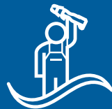
WORKFLOW Makkelijke installatie

Geberit FlowFit is een innovatief toevoersysteem dat het perfecte installatieproces mogelijk maakt. Moeiteloos en intuïtief te gebruiken, Geberit FlowFit biedt een geheel nieuwe ervaring in sanitaire installaties. Alles wat het werk op de bouwplaats moeilijk en omslachtig maakt, is bewust vermeden. In plaats daarvan maken vloeiende processen, uitstekende ideeën en een groot aantal innovatieve productkenmerken van Geberit FlowFit de sanitaire oplossing van de toekomst. Het uitgebreide concept van Geberit FlowFit en de consequente focus op productvoordelen voor sanitaire installateurs, ingenieurs en gebruikers zorgen ervoor dat alles optimaal verloopt - net zoals het hoort.