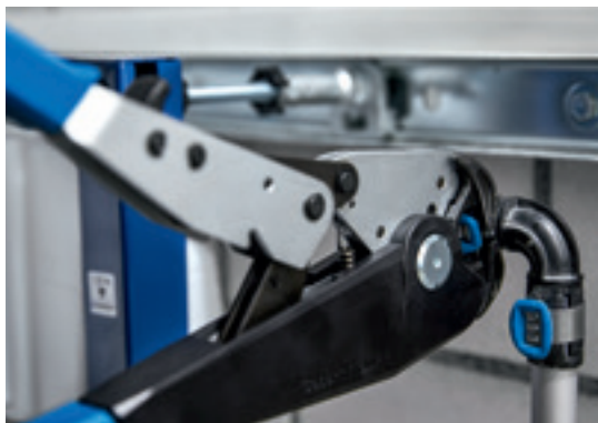
↑ Handperstangen dekken vijf afmetingen en vereisen geen voedingsspanning of oplaadbare batterijen.